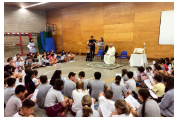
Activitat pastoral a l'escola La Immaculada

El primer col·legi que ha quedat vinculat a la nova Fundació Educació Catòlica és l'escola La Immaculada, de Sant Vicenç dels Horts, que fins al curs passat depenia de les Germanes de la Doctrina Cristiana. Precisament des de l'1 de novembre s'ha fet efectiu el canvi de titularitat i ara la Funda-